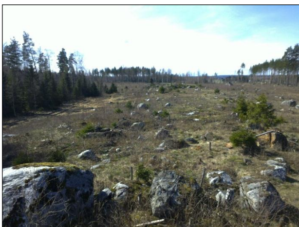
Alueen pohjoisosaa länteen