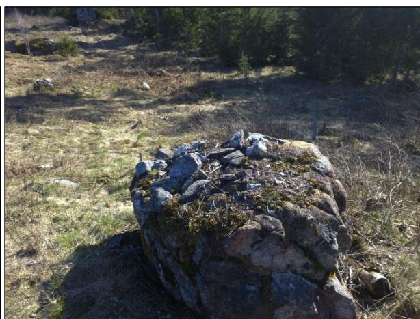
maakiven päälle nosteltu pikkukiviä