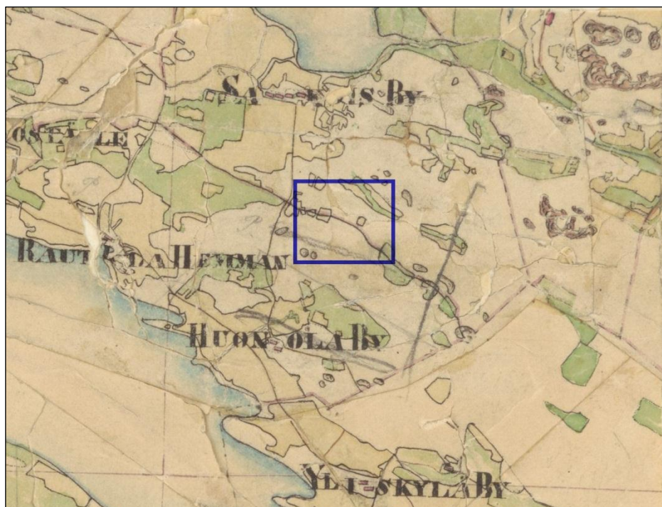
Ote pitäjänkartasta 1840-l