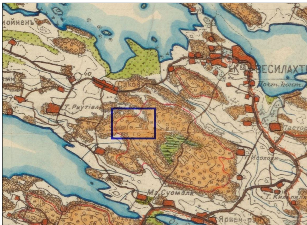
Ote ns. Senaaticartasta v. 1909