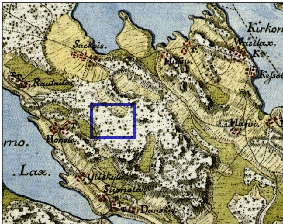
Ote ns. Kuninkaankartasta 1790-luvulta

Tutkimusalueen sijainti hahmotettu kartoille sinisellä suorakaiteella